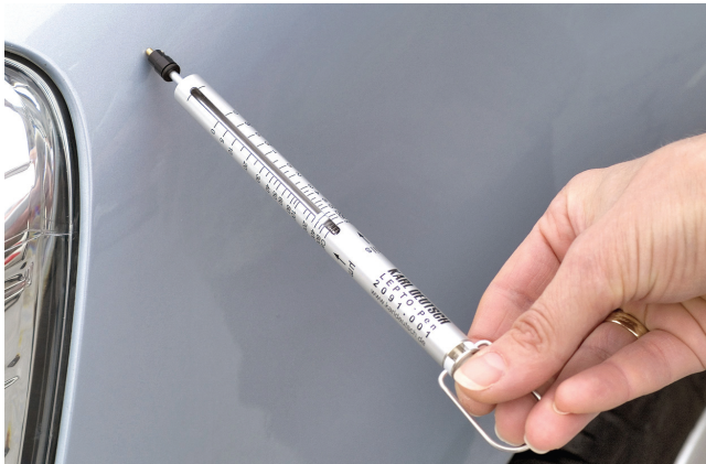
Dickenmessung an einer Fahrzeug-Lackschicht (Anwendungsbeispiel)